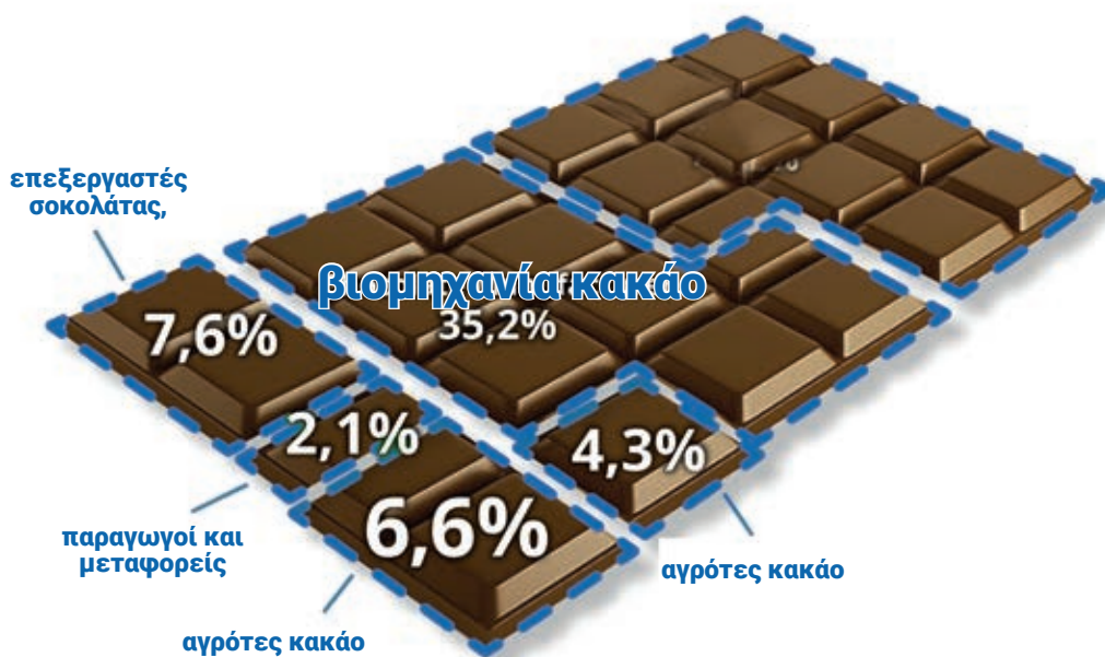
Σχήμα 2. Μερίδιο στην αλυσίδα αξίας της παραγωγής σοκολάτας