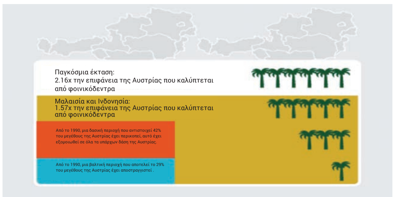
Σχήμα 3. Η επέκταση των φυτειών φοινικέλαιου στην Ινδονησία και τη Μαλαισία και η αναλογία των εκτάσεων που έχουν αποψιλωθεί για φυτείες φοινικέλαιου από το 1990.

Επιπλέον, τα κοινωνικά προβλήματα που συναντώνται συχνά περιλαμβάνουν τον εκτοπισμό μικρών γεωκτημόνων, πρακτικές απασχόλησης των φυτειών του τοπικού πληθυσμού, επισφαλείς συνθήκες εργασίας και κακή αμοιβή για πολύ επίπονη δουλειά. Έχει αναφερθεί ότι σε ένα από τα μεγαλύτερα ακίνητα φοινικέλαιου στη Μαλαισία που ανήκει στον όμιλο IOI, το ένα τρίτο των ερωτηθέντων εργαζομένων έλαβαν μισθούς βάσει επιδόσεων. Οι μισθοί αυτοί ήταν κατώτεροι από το επίπεδο της νομοθεσίας της Μαλαισίας όπου ο ελάχιστος μισθός είναι 900 Μαλαισιανά ringgits (198 Ευρώ) ανά μήνα ή 34,63 ringgits (7,6 ευρώ) την ημέρα – και επομένως ήταν ανεπαρκείς για το βιοπορισμό των εργαζομένων.