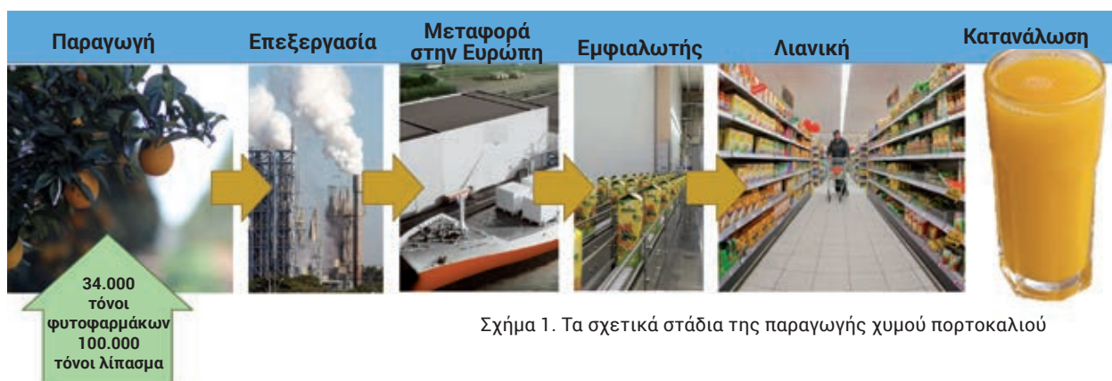
Σχήμα 1. Τα σχετικά στάδια της παραγωγής χυμού πορτοκαλιού

συνεταιρίζεσθαι ή οι συλλογικές διαπραγματεύσεις. Συγκεκριμένα, οι γυναίκες υποβάλλονται συχνά σε συνεχείς ψυχολογικές, σωματικές και σεξουαλικές επιθέσεις. Οι πολλές ώρες εργασίας εμποδίζουν την οικογενειακή ζωή, με αποτέλεσμα οι γυναίκες εργαζόμενες με παιδιά να υποφέρουν ιδιαίτερα από αυτή την κατάσταση. Ο γενικός κανόνας που επικρατεί τόσο στα εργοστάσια όσο και στο πεδίο είναι ότι εάν δε δουλεύεις, δεν πληρώνεσαι. Για τις μητέρες, αυτό σημαίνει ότι δεν μπορούν να πάνε στον γιατρό μαζί με τα παιδιά τους.